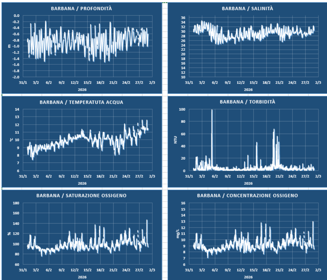
Figura 1: Misure idrologiche e di torbidità